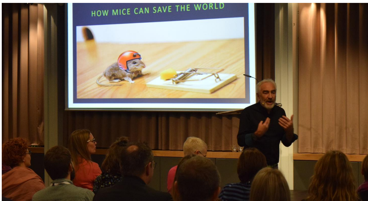
Í 2021 bar endiliga til at hava Ferðavinnustevnuna aftur. Hesaferð var hon hildin á Hotel Føroyum.