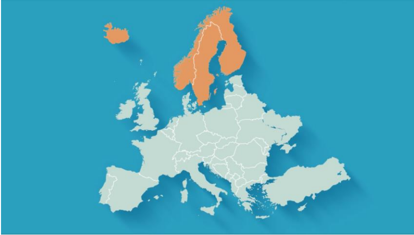
Lond, ið hava einkarsølu men ikki einkarinnskeyp

Ferðavinnufelagið er av teirri áskoðan, at talan er um eina óneyðuga forðing og at einkarinnskeypið hjá Rúsdrékkasølu Landsin eigur at avtakast. Hetta var eisini eitt valynski til lógtingsvalið í 2019. Felagið hevur í øðrum sambandi latið gjørt eitt filmsbrot fyri at lýsa trupulleikan.